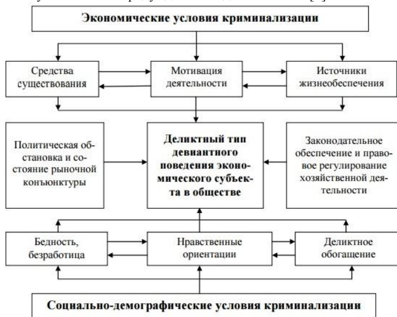
Рис. 1. Факторы, определяющие девиантное поведение субъекта

Деликт – неправомерное действие (бездействие), совершаемое субъектом, которое влечет за собой нарушение договорных обязательств, норм или принципов, влекущее за собой деликтную ответственность, которая возникает вследствие причинения имущественного вреда одним лицом другому. Под деликтным риском подразумевается возможность совершения правонарушения «деликта» в компании, что повлечет отрицательное последствие для его финансово хозяйственной деятельности [4].