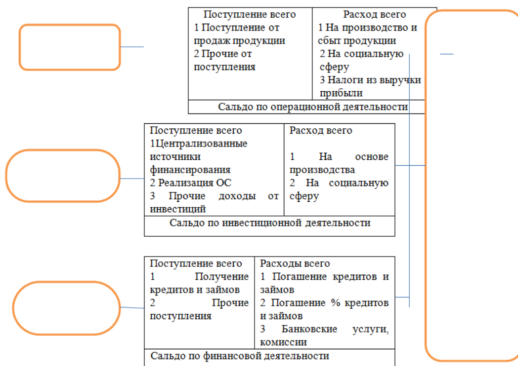
Рис. 1. Укрупненная схема бюджета движения денежных средств (БДДС) на год/месяц

Укрупненная схема бюджета движения денежных средств (БДДС) на год/месяц приведена на рис. 1.