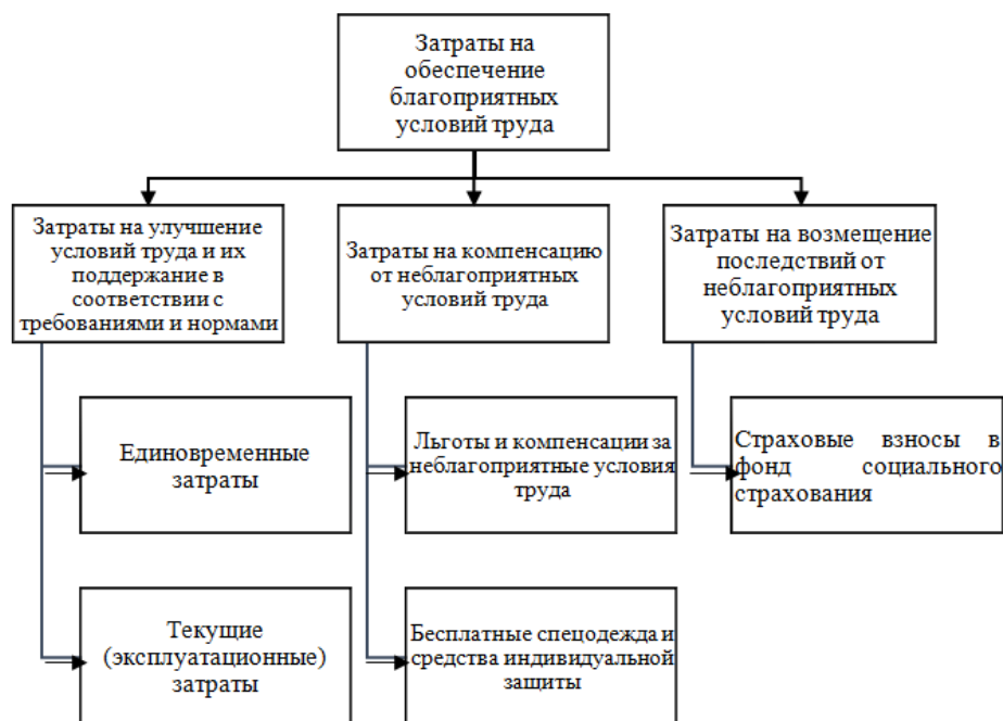
Рис. 1. Структура затрат, связанных с условиями труда

При этом первые из них могут идти по смете капитальных затрат, тогда как вторые возобновляются периодически в связи с необходимостью обеспечения благоприятных условий труда в соответствии с действующими нормами, правилами и требованиями. Эксплуатационные расходы и часть единовременных затрат полностью списываются в установленном порядке на себестоимость продукции текущего года по статье условно-постоянных расходов. Капитальные затраты, как известно, переносятся на себестоимость путем амортизационных отчислений.