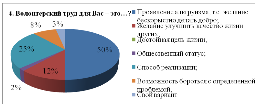
Рис. 1. Волонтерский труд для Вас – это...

Для 32 (18%) одной из главных причин того, что они стали волонтерами являются новые знакомства с нужными людьми, 25 (13%) стали волонтерами для того чтобы получить опыт, развить различные навыки, стать личностью. Чуть меньше респондентов, а именно 23 (13%) ответили, что хотят помогать людям/животным, а так же посещать определенные мероприятия, здесь так же можно выделить фактор заинтересованность тем или иным направлением деятельности, для 15 (8%) это является способом и возможностью применить свои уже имеющиеся знания, навыки и опыт на практике. Из числа опрошенных 5 (3%) дали «свой вариант» ответа, вот как они звучат: