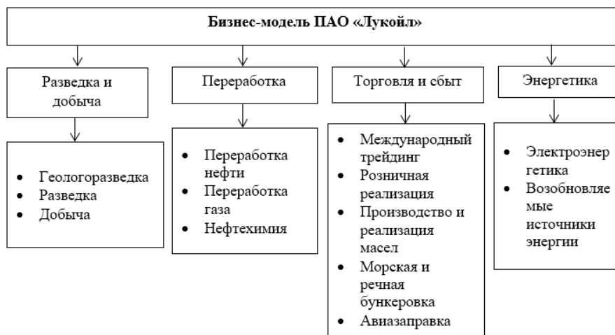
Рис. 1. Бизнес-модель ПАО «Лукойл»

В сравнение с российскими нефтяными компаниями, а также с международными нефтяными компаниями ПАО «Лукойл» сохраняет устойчивое лидерство по эффективности, которое достигается за счёт рациональной бизнес-модели (рис. 1), основанной на принципе максимальной вертикальной интеграции [3] в целях создания добавленной стоимости и обеспечения высокой устойчивости бизнеса в меняющейся макросреде путём диверсификации рисков.